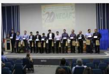
Ex-coordenadores das 16 gestões do Necaf recebem homenagem