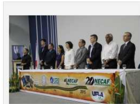
Cerimônia de Lançamento de livros sobre café e celebração dos 20 anos do Necaf