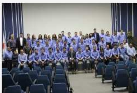
Durante a cerimônia, também foi dado destaque aos 20 anos de atuação do Núcleo de Estudos em Cafeicultura (Necaf)

O trabalho desenvolvido honra os estudos pioneiros da ESAL-UFLA nessa temática. Afinal, a história do Necaf se confunde com a consolidação das pesquisas com café na UFLA, tendo sido intensificadas por meio de parcerias estratégicas com tradicionais colaboradores, como a Empresa de Assistência Técnica e Extensão Rural de Minas Gerais (Emater MG) e a Empresa de Pesquisa Agropecuária de Minas Gerais (Epamig).