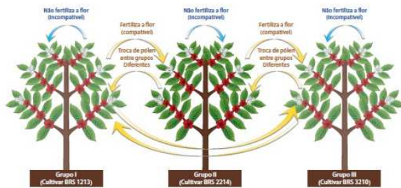
Figura 1. Ao contrário do café arábica, a autocompatibilidade do café caniflora impede sua autofecundação. Assim, durante a florada do café caniflora, as flores da cultivar BRS 1213 (Grupo I) precisam receber pólen das outras cultivares de grupos diferentes (grupos II ou III), e vice-versa. Somente assim ocorrerá a fecundação das flores. Esse mecanismo é chamado de autocompatibilidade gametofítica, controlada por um gene "S" constituído por três alelos (S1, S2 e S3).