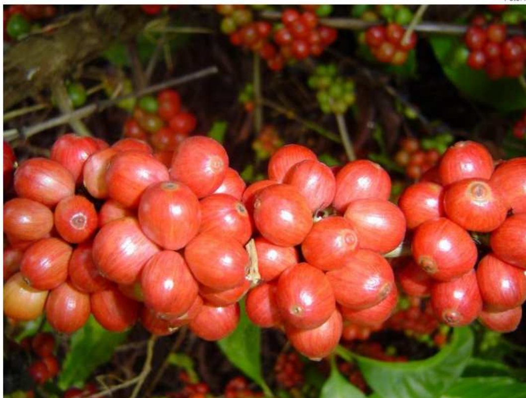
A expectativa é de que haja aumento na produção de conilon.