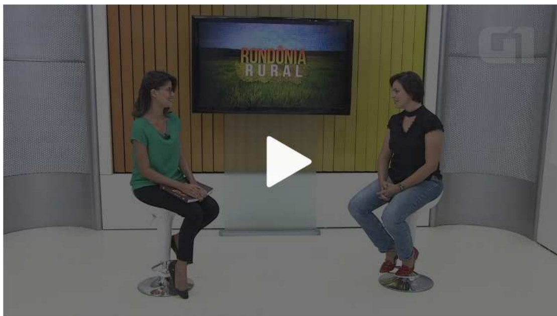
Bate-papo rural: Livro sobre mulheres no café é lançado e disponibilizado gratuitamente