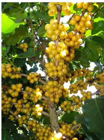
Paraíso é uma das 15 cultivares desenvolvidas pelo Programa de Melhoramento Genético do Cafeeiro da Epamig