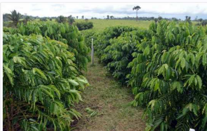
A propriedade possui dois hectares de café tecnificado plantados.

19 de abril de 2018 | Governo do Estado de Rondônia