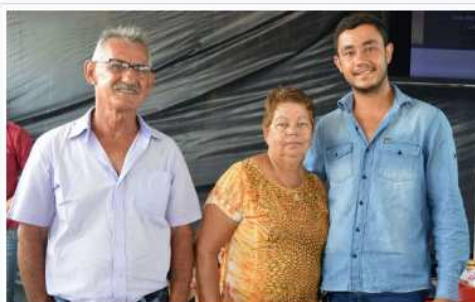
Orgulho ao ver o filho formado em medicina veterinária.