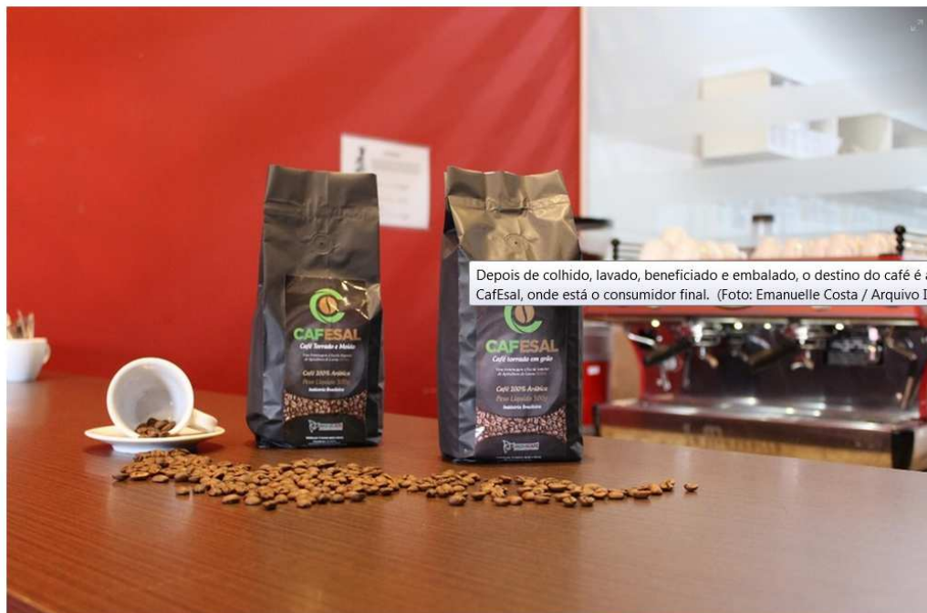
Depois de colhido, lavado, beneficiado e embalado, o destino do café é a cafeteria Cafesal, onde está o consumidor final.

Após a colheita, os frutos são transportados para a unidade de pós-colheita, onde os grãos passam por um lavador, ocorrendo a separação dos frutos verde e cereja e dos frutos bóia. A expectativa da universidade é colher cerca de 400 sacas quando a área de plantio estiver estabilizada, com pico máximo de produção, ou seja, quando toda área for produtiva, o que deve ocorrer em três anos.