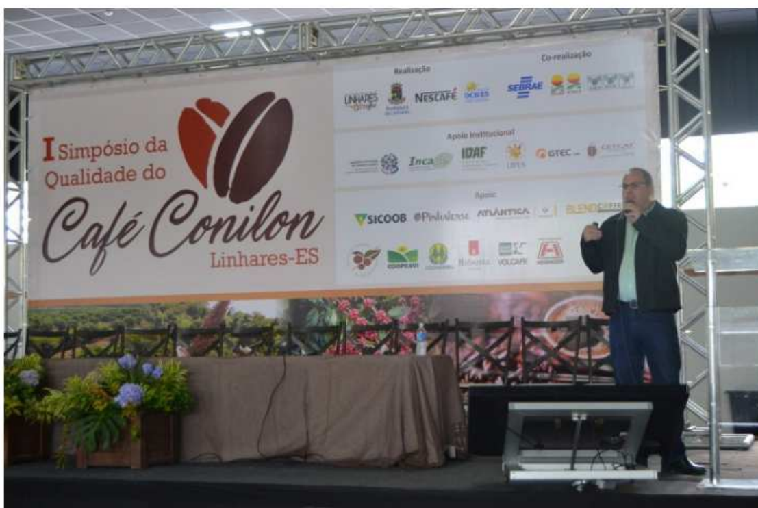
O evento contou também com um Dia de Campo.