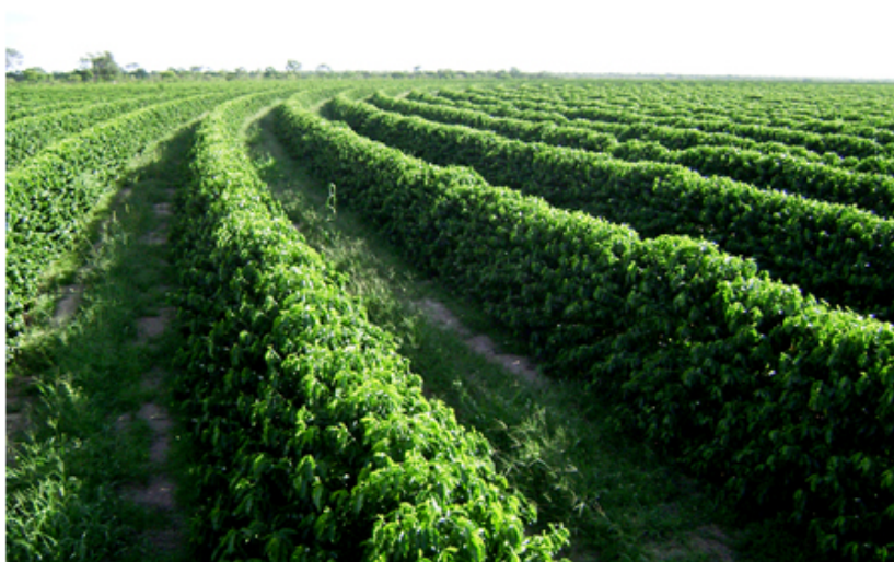
Minas Gerais lidera produção e premiações

A multiplicação de cafeterias no Brasil contribui para um novo hábito: degustar café fora de casa em estabelecimentos especializados. Hoje praticamente todas as regiões cafeeiras do Brasil produzem grãos especiais, como Cerrado, Zona da Mata e Sul de Minas Gerais, Serra do Espírito Santo, Bahia, São Paulo e Paraná. Mas, em se tratando de cafés especiais, Minas Gerais ganha destaque com cerca de 65% da produção brasileira.