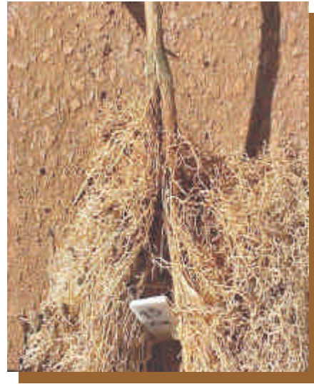
Figura 2 - Sistema radicular bifurcado (split-root).