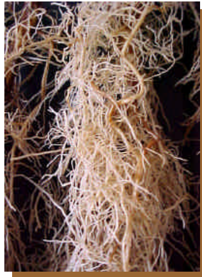
Figura 5 - Raízes sem galhas da cultivar IAPAR 59.