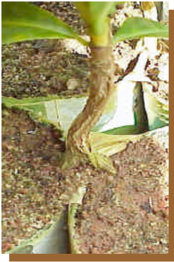
Figura 1 - Cafeeiro em sistema split-root.

calculando-se o fator de reprodução FR ( Pf/Pi ). As raízes foram lavadas e submetidas à técnica de Hussey e Barker (1973), para extração de ovos.