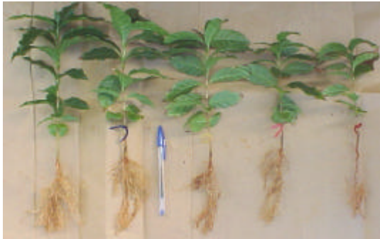
Figura 1 - Desenvolvimento radicular reduzido à medida que eleva-se a salinidade da água de irrigação aos 197 dias.