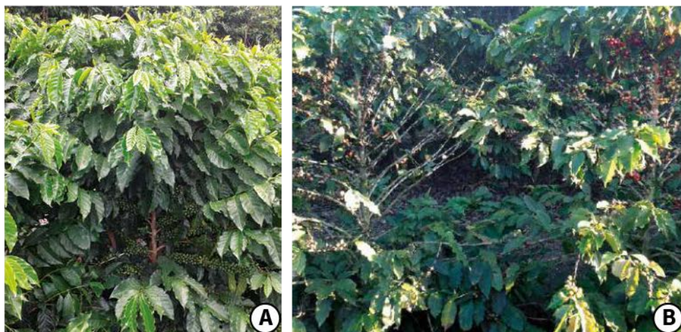
Figura 1. Plantas jovens com alto potencial produtivo (A); e plantas adultas com potencial produtivo reduzido demonstrando a necessidade de interferência de podas (B).

Após sucessivas colheitas, é comum observar, em campo, a perda de vigor das hastes ortotrópicas e dos ramos plagiotrópicos, que se tornam pouco produtivos, paralelamente ao aumento da altura das plantas (Figura 1).