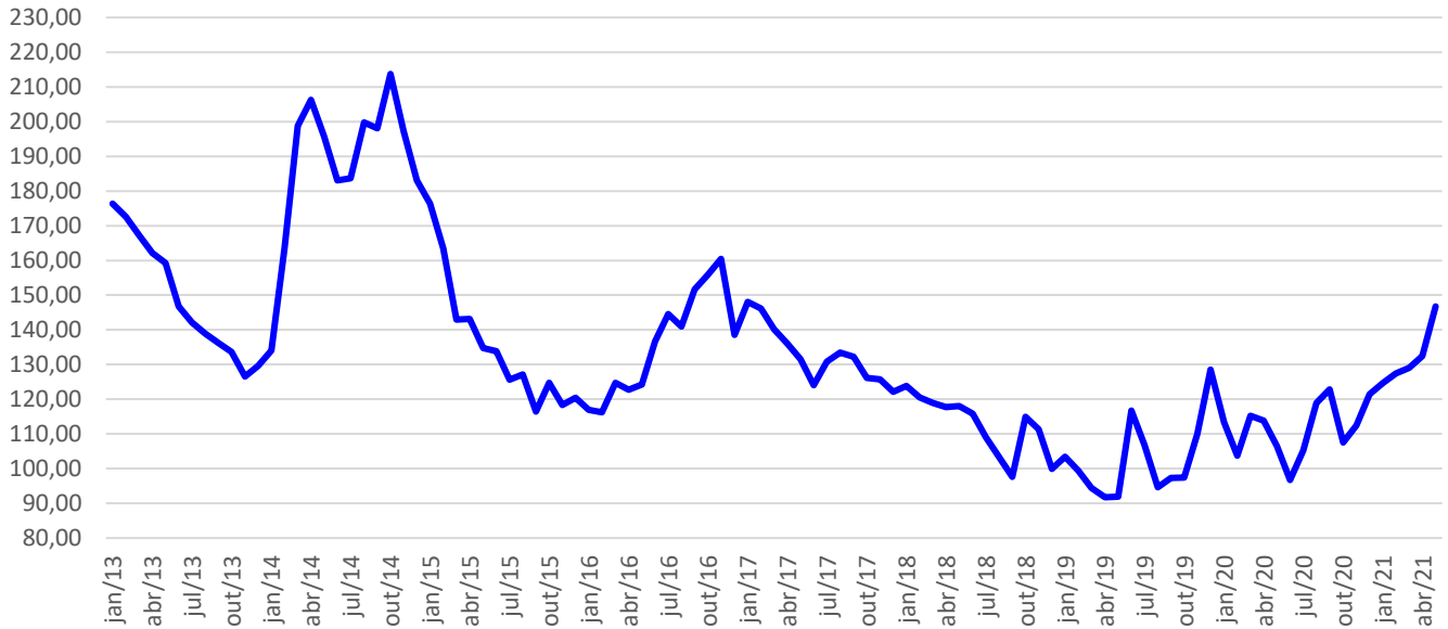
Preços médios mensais de café robusta - Londres